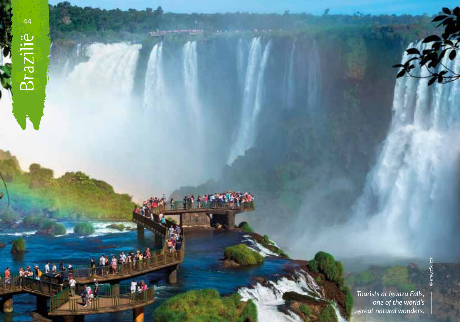
Tourists at Iguazu Falls, one of the world's great natural wonders.